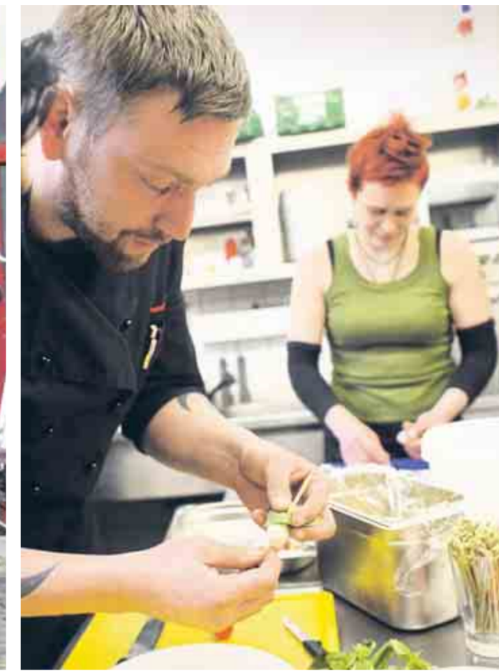
Kochkurs für Hartz-IV-Empfänger im Bürgerhaus Mülze.