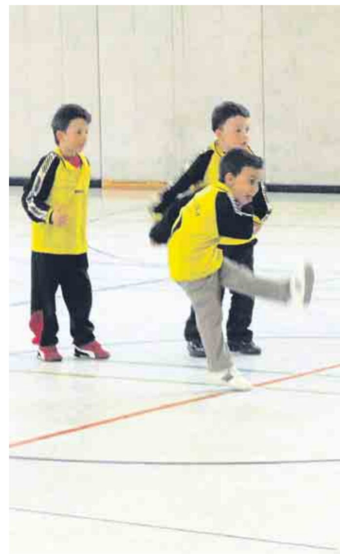
Das erste Turnier der Bambini-Liga Mülheim fand 2012 statt.

Quelle: Zahlen aus dem Datenprofil der Sozialraumgebiete, ermittelt vom Amt für Stadtentwicklung und Statistik. Die letzten verfügbaren Zahlen für die Gebiete, die nur zum Teil mit den Stadtteilen identisch sind, stammen aus dem Jahr 2010.