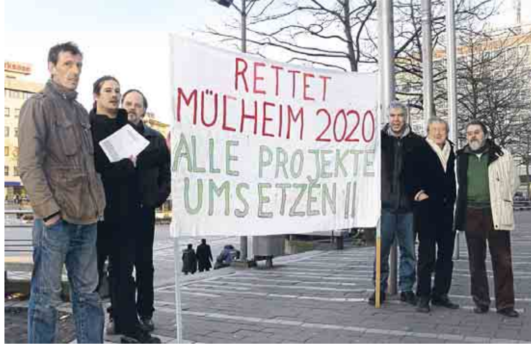
Mitarbeiter der Sozialistischen Selbsthilfe Mülheim protestierten vor dem Bezirksrathaus dagegen, dass nur Teile des Programms Mülheim 2020 umgesetzt werden können.