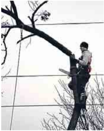
Ein Arbeiter in Aktion

Humboldt-Gremberg. Baumschnitt in luftigen Höhen kann man zurzeit an einigen Bahnstrecken in Köln beobachten. Die Deutsche Bahn lässt, wie an der Güterbahnstrecke durch Humboldt-Gremberg, Bäume entweder kurz schneiden oder gar fällen. „Wir machen das an solchen Stellen, wo die Bäume Oberleitungen oder Signalmasten gefährden können“, so ein Bahnsprecher. Außer dem Abschnitt zwischen der Südbücke und dem Güterbahnhof Kalk konzentrieren sich die Vegetationsarbeiten laut Bahnsprecher auf alle stark befahrenen Güterzugstrecken des Kölner Stadtgebiets sowie auf die Gleisanlagen entlang der sogenannten Rheinschiene. Dort werde sowohl der Güter- als auch der Personenverkehr auf gemeinsamen Trassen abgewickelt. Schwerpunkte seien auch der West- und der Südbahnhof. Der Zeitpunkt sei bewusst gewählt. „Im Winter ruht die Vegetation und es nisten keine Vögel“, so der Bahnsprecher. (aef)